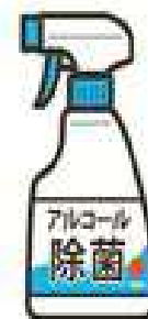
机や椅子やドアノブ等 の除菌